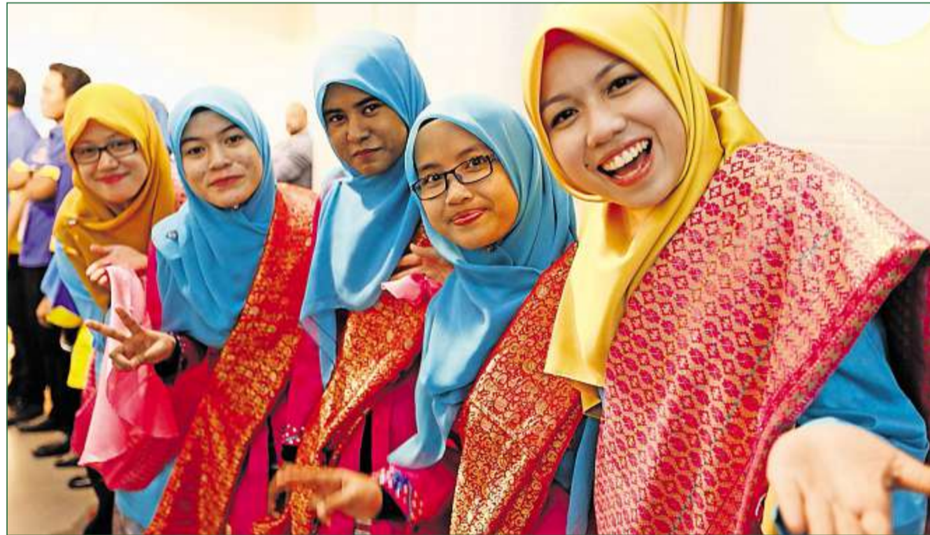
40 Studenten der Universität Malaysia Perlis sind in farbenprächtigen Gewändern gemeinsam mit dem Kronprinzen nach Regensdorf gekommen. Auf ihrer Reise durch die Schweiz werden sie bekannte Orte besuchen.